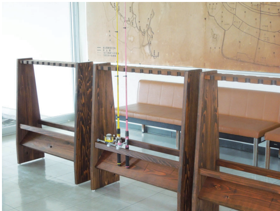
ムツかけ用の竿立て